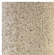
Copertura in pietra